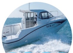
海上タクシー (貸切)