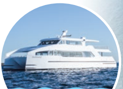
チャータークルーズ

「SHONAN江の島棧橋」のある湘南港を起点として海上交通「かながわシーライド」を運航しています。渋滞を気にすることなく、海の魅力を体感しながら観光やレジャーを楽しめます。