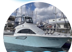
海上タクシー (乗合)