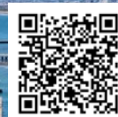
かながわシーライドについてはこちらから