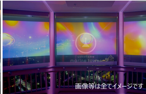
画像等は全てイメージです