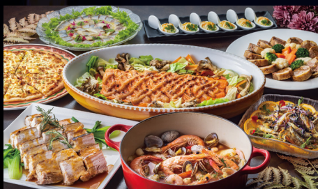
夕食:buffet形式イメージ

クリスマスだけの特別なディナーコースもご用意があります。追加代金13,000円(※現地払い)にてご予約が可能です。 ご予約の際に、申込有無についての質問がございますので、ご希望の場合はご回答ください。 クリスマスディナーでない場合は、通常のbuffet食となります。