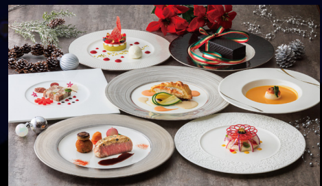
夕食:クリスマスディナーイメージ